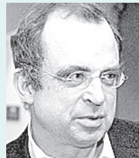
Moderation: Krzysztof Michalski IWM