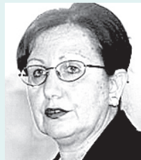
Seyla Benhabib Politikwissen- schafterin, Yale University