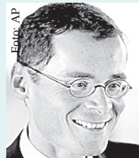
Roger Köppel Chefredakteur der Weltwoche, Zürich